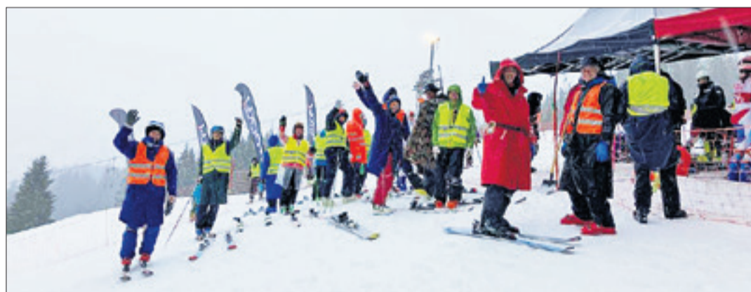
Die Helfer geben vollen Einsatz bei bester Laune – egal bei welchen Wetterbedingungen.