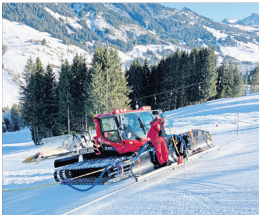
Es wurde alles getan, um den Athleten eine perfekte Piste präsentieren zu können.